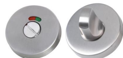
Condamnation avec voyant