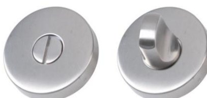
Condamnation sans voyant