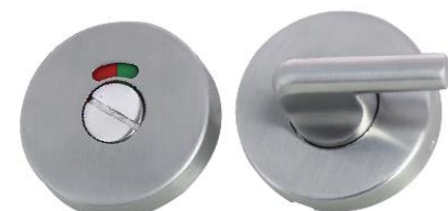
Condamnation avec voyant PMR